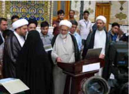
سحب قرعة الحج من قبل الامين العام للعتبة العلوية المقدسة وتقديمه بواسطة سماحة الشيخ محمد تقى المولى رئيس الهيئة العليا للحج والعمرة ممثلًا عنه سماحة الشيخ علي المولى