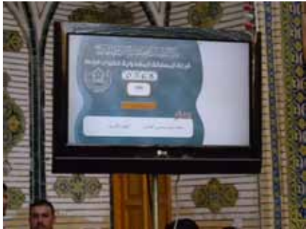
جانب من برنامج القرعة الالكتروني