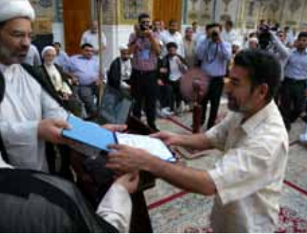
تقديم الجوائز بواسطة سماحة الشيخ ستار الجيزاني مسؤول الشؤون الدينية في العتبة العلوية المقدسة