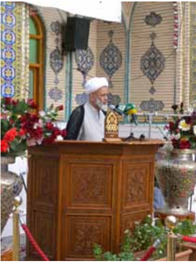
كلمة الامين العام للعتبة العلوية المقدسة سماحة الشيخ ضياء زين الدين