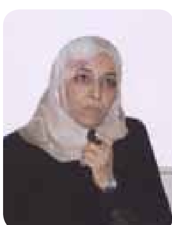
المسؤول في جمعية البعثة رابحة الزينة